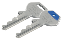
Standardschlüssel mit eckiger Reide und seitlichem Sperrelement sowie optionalem Miniclip